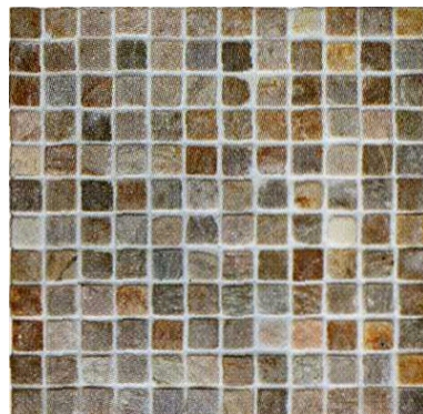
2,3x2,3 MOSAICO QUARZITE MODULO SU RETE 30,5x30,5