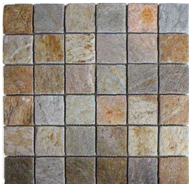
5x5 MOSAICO QUARZITE MODULO SU RETE 30,5x30,5