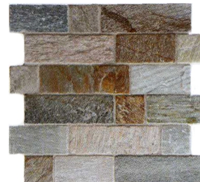
OPUS MOSAICO 5 MODULO SU RETE 30,5x30,5