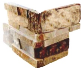
18x18 MURO QUARZITE MODULO ANGOLARE