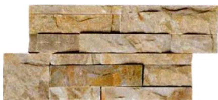
18x35 MURO QUARZITE MODULO LINEARE