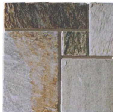
OPUS ROMANO MODULO SU RETE 40x40